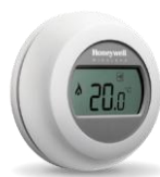
Y87 digitális szobai termosztát

Ha hőmérséklet érzékelőként vezeték nélküli szobai termosztát használatát írják elő, akkor a Honeywell DT92 digitális szobai termosztátja és az Y87 egyzónás szobai termosztát egyaránt beépíthető az evohome rendszerbe.