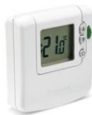
DT92 digitális szobai termosztát