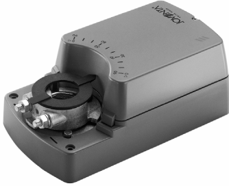
Standard, 2- és 3-pont működésű villamos zsalumozgatók